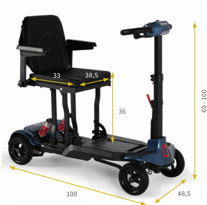
Medidas en cm