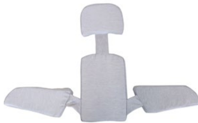
Kit de ajuste del asiento