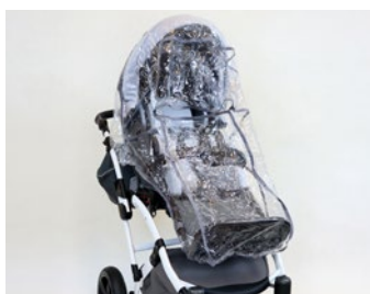
Protector para lluvia