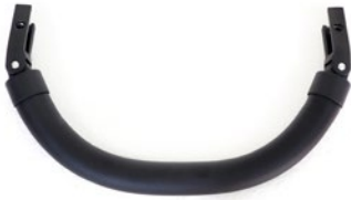
Barra de seguridad