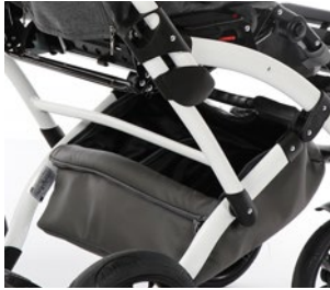
Bolsa bajo asiento