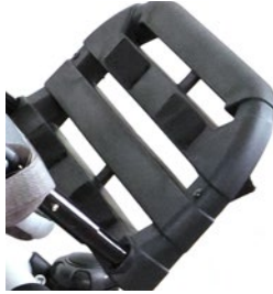
Reposapiés con cinchas