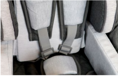
Cinturón 5 puntos con inserciones acolchadas