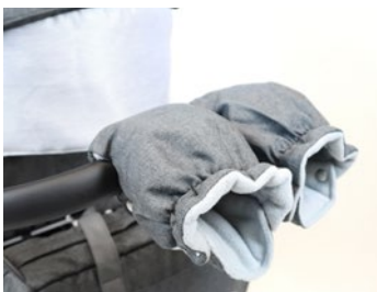
Gautes de invierno