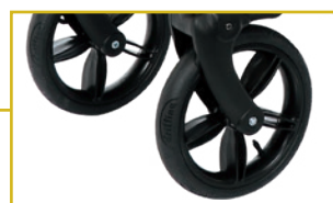
Ruedas delanteras y traseras con amortiguación