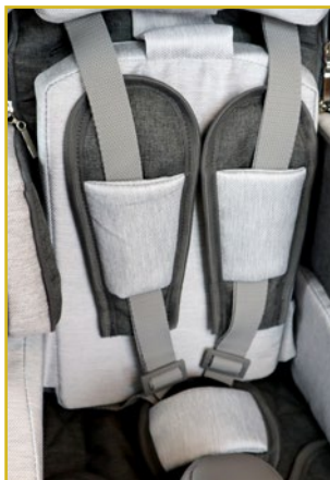
Cinturón 5 puntos con inserciones acolchadas