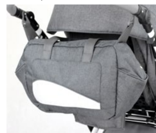
Bolsa manillar (varios colores)