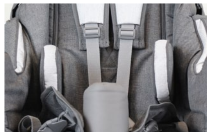
Controles tronco (varios colores)