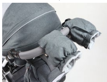
Guantes invierno (varios colores)