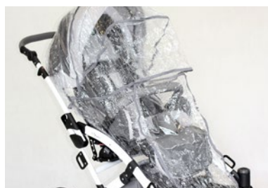
Protector para lluvia