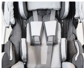
Cinturón 5 puntos con inserciones acolchadas