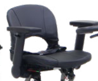
Cinturón de seguridad