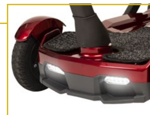
Luces LED delanteras y traseras