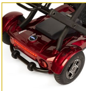
Ruedas neumáticas y antivuelco