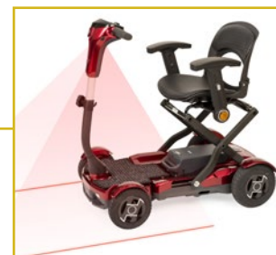
El laser indica el espacio de seguridad necesario para circular