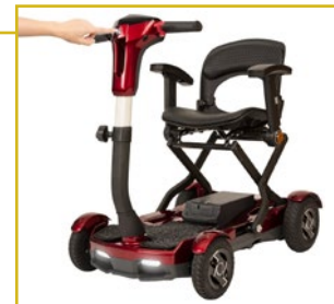
Botón de plegado de fácil acceso