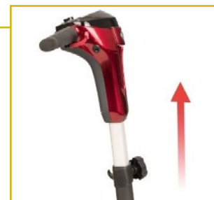
Manillar ergonómico y regulable en altura