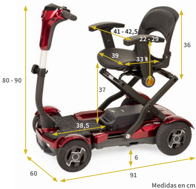
Medidas en cm