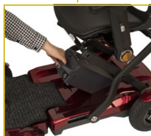
Batería de litio extraíble (14,5 Ah) para facilitar su carga