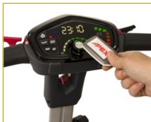
Pantalla multifunción y llave de proximidad