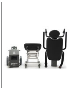
Desmontable en diferentes secciones: mástil, columna y asiento (según modelo), lo que facilita su transporte.