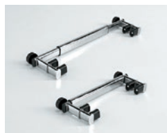
Barra ajustable para el Yack 972 y Yack 973.