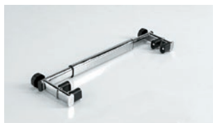
Barra ajustable para modelos Sherpa.