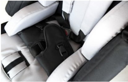
Kit ajuste asiento