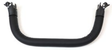
Barra de seguridad