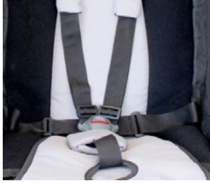
Cinturón 5 puntos con inserciones acolchadas