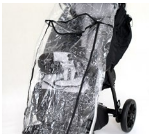
Protector para la lluvia