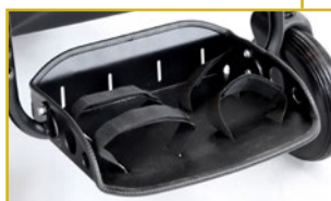
Reposapiés plegable con cinchas y ajustable en altura