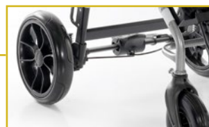
Ruedas traseras con amortiguación