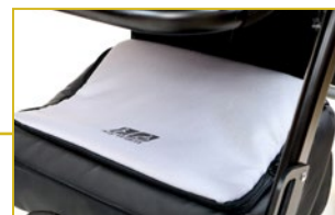
Bolsa bajo asiento