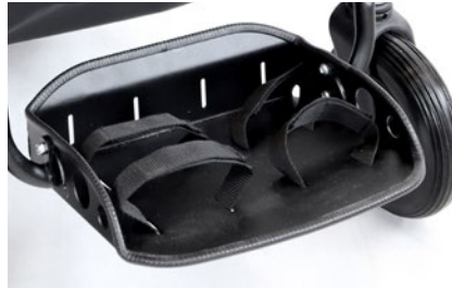
Reposapiés con cinchas