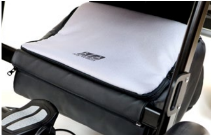
Bolsa bajo asiento