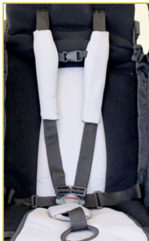
Cinturón 5 puntos con inserciones acolchadas