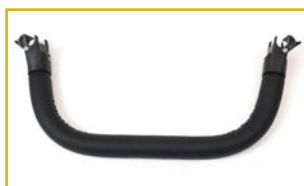
Barra de seguridad