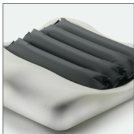
Compuesto de cuatro celdas de aire de presión alternante sobre una base.

Incorpora una funda bi-elástica que reduce la fricción. Es resistente al agua y fácil de lavar.