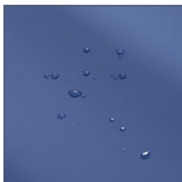
Funda PU bi-elástica, transpirable e impermeable al agua.