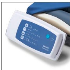
Compresor compacto, de fácil uso y silencioso.