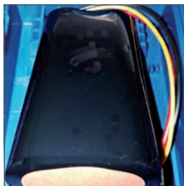
Batería de litio de larga duración que permite utilizarlo con una autonomía de hasta 12 horas.