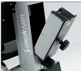
Batería desmontable para facilitar la recarga.

El Yack es el salva escaleras que permite subir y bajar escaleras rectas y de caracol. Se va adaptando a las necesidades del paciente, pasando del modo asiento (Yack 971) al modo silla de ruedas (Yack 972 / 973). Desmontable en diferentes secciones para facilitar su traslado. Con batería desmontable que permite su recarga sin mover todo el equipo.