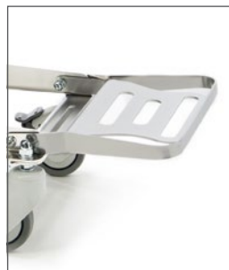
En el Yack 971 los reposabrazos y reposapiés son abatibles para mayor confort del usuario.