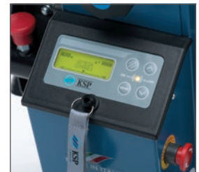
Nuevo panel de control digital que permite introducir al cuidador diversos parámetros (velocidad, modo de subir las escaleras: individualmente/ciclo continuado...) garantizando un uso seguro y simple del sube escaleras.