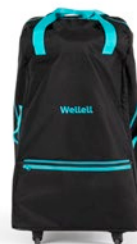
Bolsa de transporte