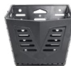
Cesta delantera plegable