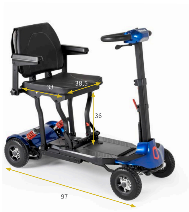
Medidas en cm