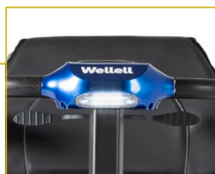
Luz LED delantera