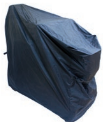
Funda de almacenaje