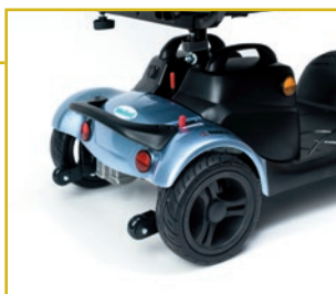
Palanca de desembrague y ruedas antivuelco