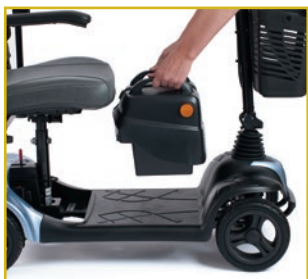
Baterías extraíbles para facilitar su recarga