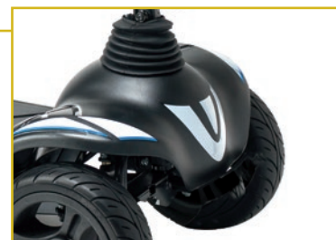
Luz led delantera