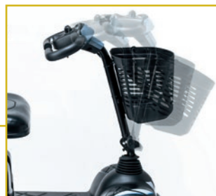
Columna de conducción