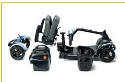
Desmontable en 4 piezas