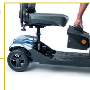
Baterías extraíbles para facilitar su recarga