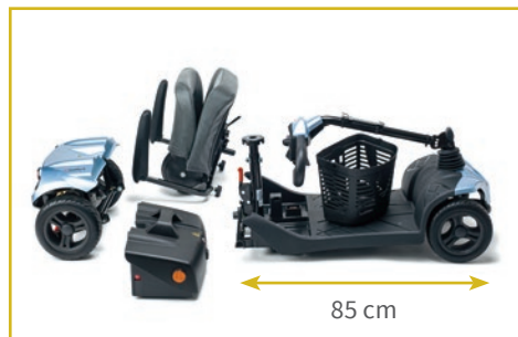
Desmontable en 4 piezas