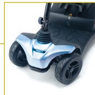
Luz led delantera