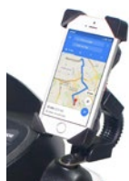
Soporte para móvil