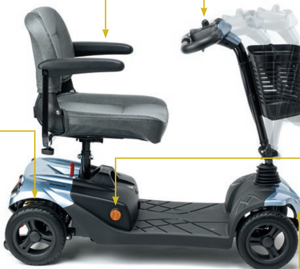
Columna de conducción