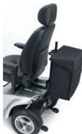
Bolsa trasera con portabastones doble