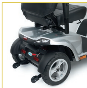
Suspensión trasera. Palanca de desembrague y ruedas antivuelco