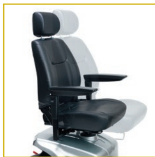
Asiento giratorio y regulable en profundidad