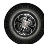
Rueda maciza delantera