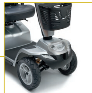
Suspensión delantera. Con luces de freno, delantera, intermitente y emergencia