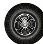
Rueda maciza trasera