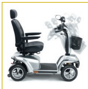
Columna de conducción regulable