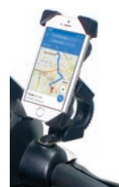
Soporte para móvil