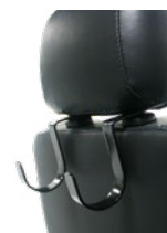
Colgadores para bolso