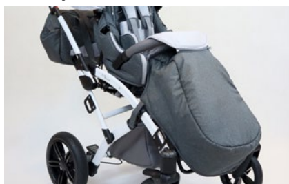
Saco (varios colores)