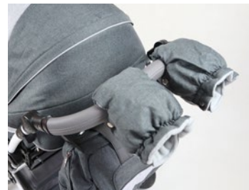
Guantes invierno (varios colores)