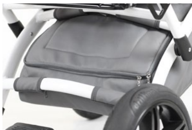
Bolsa bajo el asiento