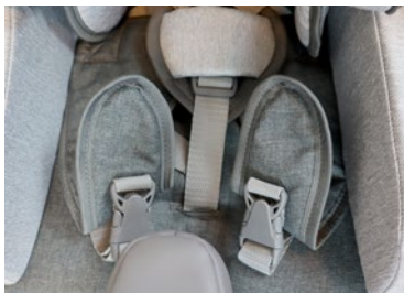
Arnés pélvico (varios colores)