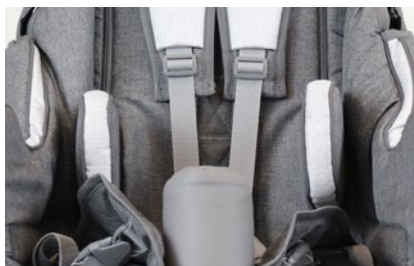
Controles tronco (varios colores)