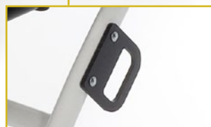
Kit de transporte