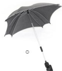
Sombrilla (varios colores)