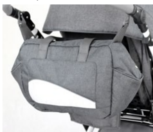
Bolsa manillar (varios colores)