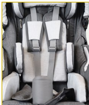
Cinturón 5 puntos con inserciones acolchadas