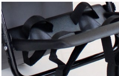
Reposapiés con cinchas