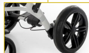
Ruedas delanteras y traseras con amortiguación