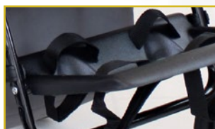
Reposapiés plegable con cinchas y ajustable en altura