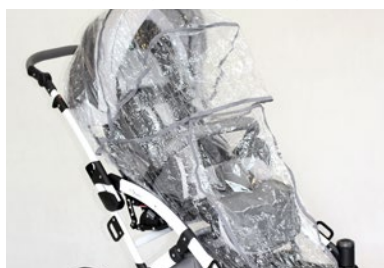
Protector para lluvia