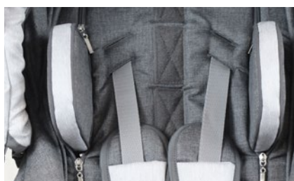
Controles cabeza (varios colores)