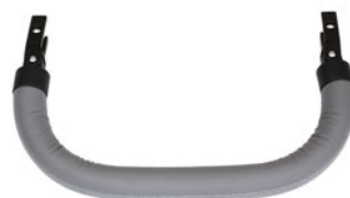
Barra de seguridad