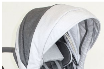
Capota (varios colores)