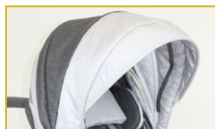
Capota (varios colores)