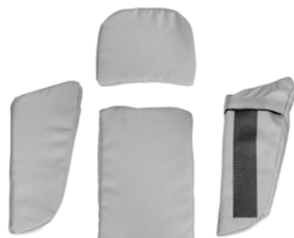
Kit ajuste asiento (varios colores)