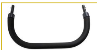
Barra de seguridad