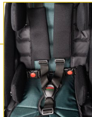
Cinturón 5 puntos con inserciones acolchadas