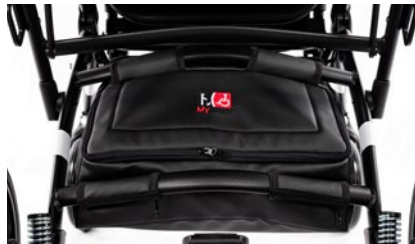
Bolsa bajo asiento