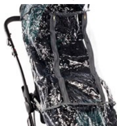
Protector para la lluvia