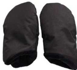
Guantes de invierno