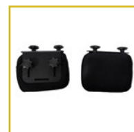
Incluye protectores laterales, controles torácicos, cefálicos y pélvicos.