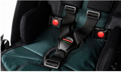
Cinturón 5 puntos con inserciones acolchadas