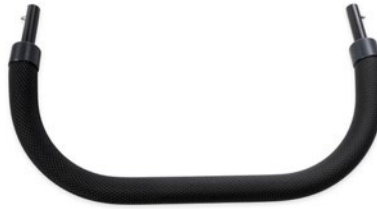
Barra de seguridad