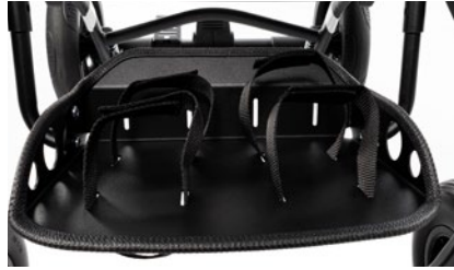
Reposapiés con cinchas