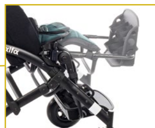
Reposapiés plegable con cinchas y ajustable en altura