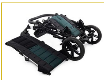
Estructura plegable y desmontable en 2 partes