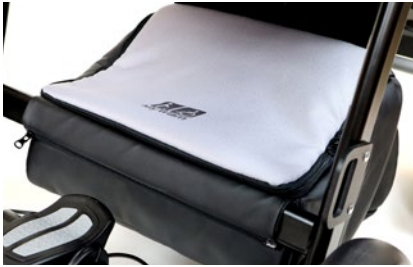
Bolsa bajo asiento