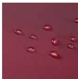
Funda PU bi-elástica, transpirable e impermeable al agua.