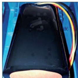
Batería de litio de larga duración que permite utilizarlo con una autonomía de hasta 12 horas.