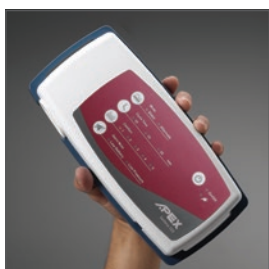
Compresor compacto, de fácil uso y silencioso.