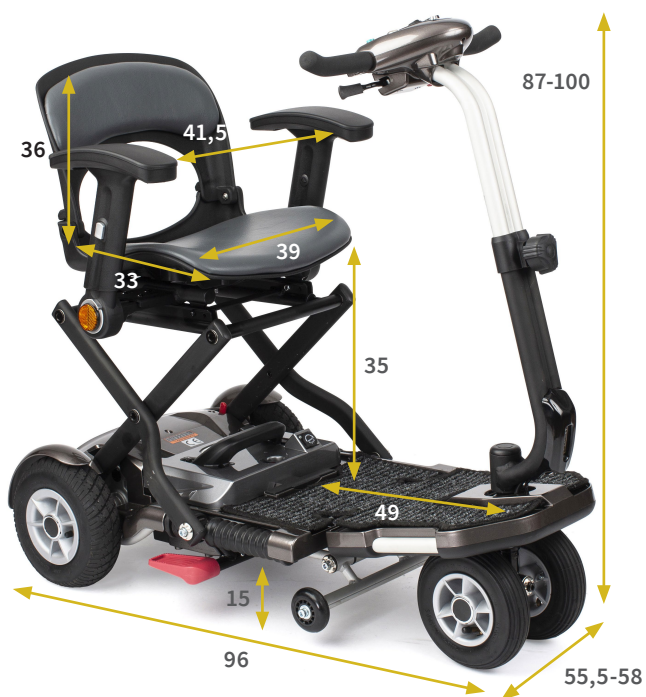
Medidas en cm