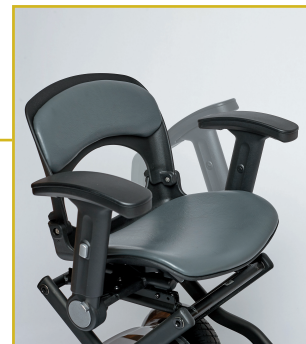
Reposabrazos abatibles y regulables en altura y anchura