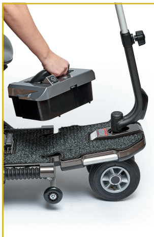
Batería de litio extraíble para facilitar su carga