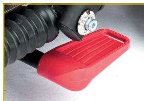
Presionar el pedal para el plegado /desplegado