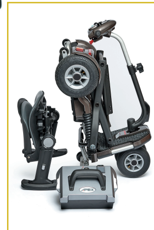
Desmontable en 3 piezas