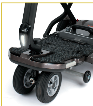
Luz LED delantera