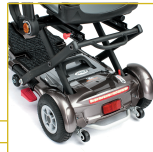
Palanca de desembrague y ruedas antivuelco. Luz trasera