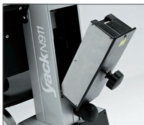
Batería desmontable para facilitar la recarga.

El Yack es el salva escaleras que permite subir y bajar escaleras rectas y de caracol. Se va adaptando a las necesidades del paciente, pasando del modo asiento (Yack 961) al modo silla de ruedas (Yack 962 / 963). Desmontable en diferentes secciones para facilitar su traslado. Con batería desmontable que permite su recarga sin mover todo el equipo.