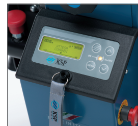
Nuevo panel de control digital que permite introducir al cuidador diversos parámetros (velocidad, modo de subir las escaleras: individualmente/ciclo continuado...) garantizando un uso seguro y simple del sube escaleras.