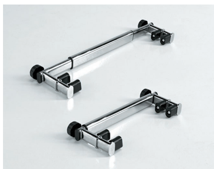
Barra ajustable para el Yack 962 y Yack 963.