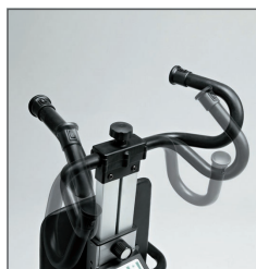
Timón regulable en altura y ajustable para adaptarlo al cuidador.