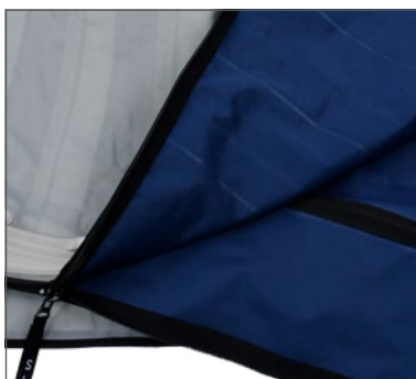
Fundas de Calidad Premium