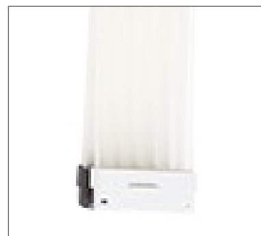
Conector seguro a prueba de torsión