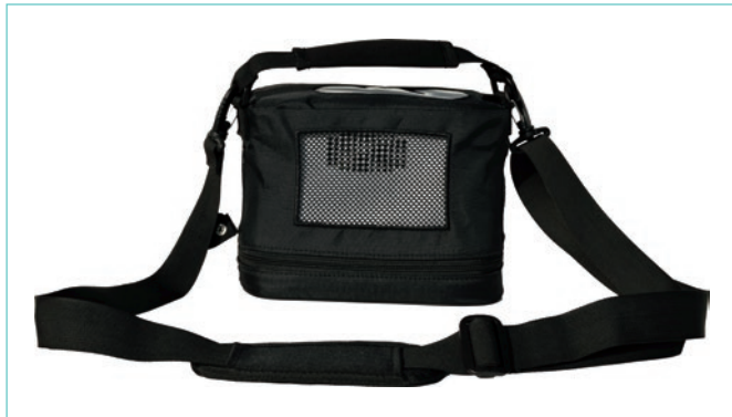
El POC incluye bolsa de transporte