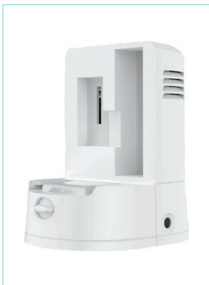
Base de carga externa