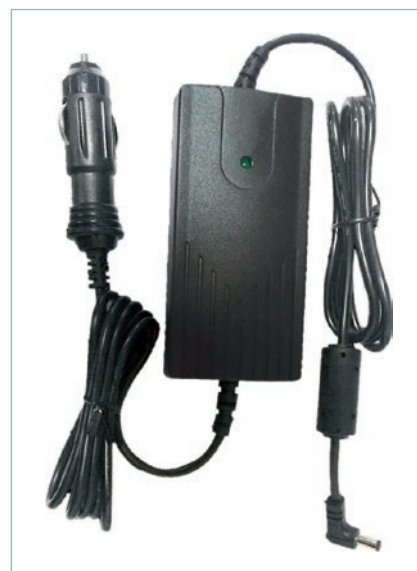
Adaptador para coche