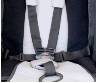
Cinturón 5 puntos