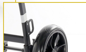
Kit de transporte