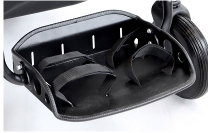
Reposapiés con cinchas