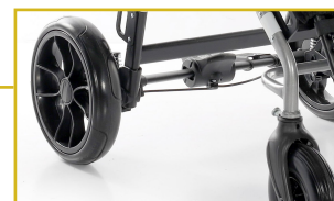
Ruedas traseras con amortiguación