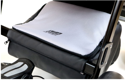
Bolsa bajo asiento