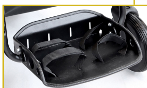
Reposapiés plegable con cinchas y ajustable en altura