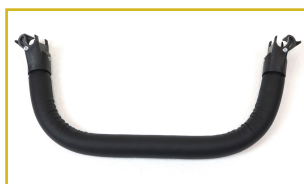
Barra de seguridad