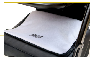
Bolsa bajo asiento