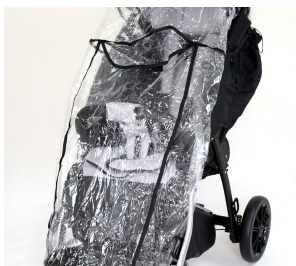
Protector para la lluvia