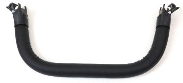
Barra de seguridad