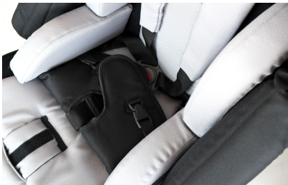
Kit ajuste asiento